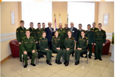
Победители олимпиады по химии

ХИМИЯ ВОЕННАЯ ИСТОРИЯ МАТЕМАТИКА ИНОСТРАННЫЕ ЯЗЫКИ ИНФОРМАТИКА ВОЕННО-ПРОФЕССИОНАЛЬНАЯ ПОДГОТОВКА