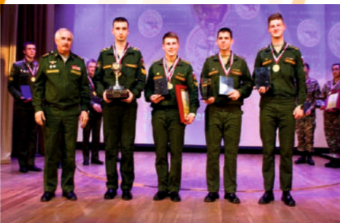
Победители олимпиады по английскому языку